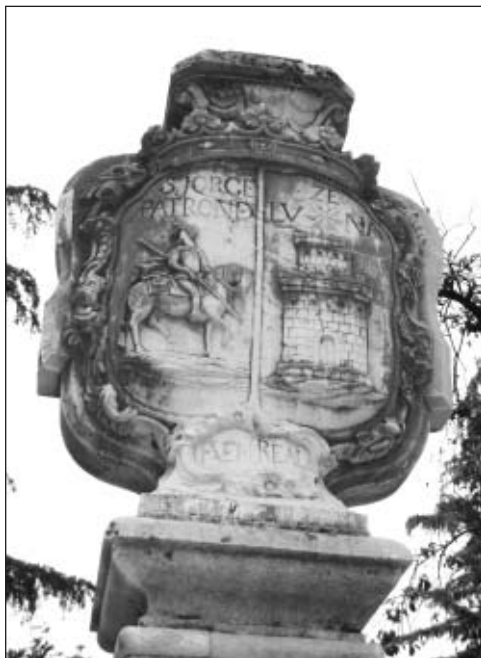
En la fuente del llanete de San Francisco se mantiene el escudo de Lucena con San Jorge.